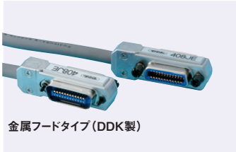
金属フードタイプ (DDK製)