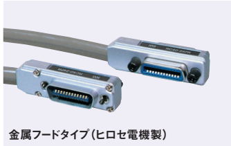
金属フードタイプ (ヒロセ電機製)